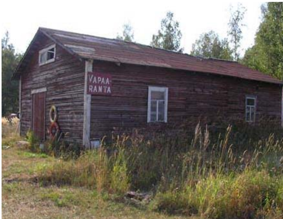
Vapaarannan verkkokuuri odottaa uutta huopakattoa.

Kotkan Vapaa-ajattelijat ry sai Saarela-tilaan (285-407-1-395; rekisteröity 13.11.1980) lainhuudon 31.1.1984. Tilan pinta-ala on 4,995 ha. Yhdistys julisti tilan Vapaarannaksi, jonne saivat rantautua kaikki, jotka tulivat saarelle rehellisissä aikeissa ja virkistystä hakemaan. Tila toimi myös etappipaikkana kalaretkillä. Tilaa käytetään erilaisten kesäpäivien ja –leirien pito- paikkana. Siellä on ollut mm. useita Prometheus -leirejä.