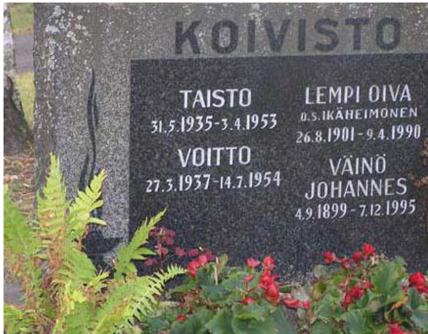
Koivistojen hauta Jyväskylän maaseurakunnan hautausmaalla