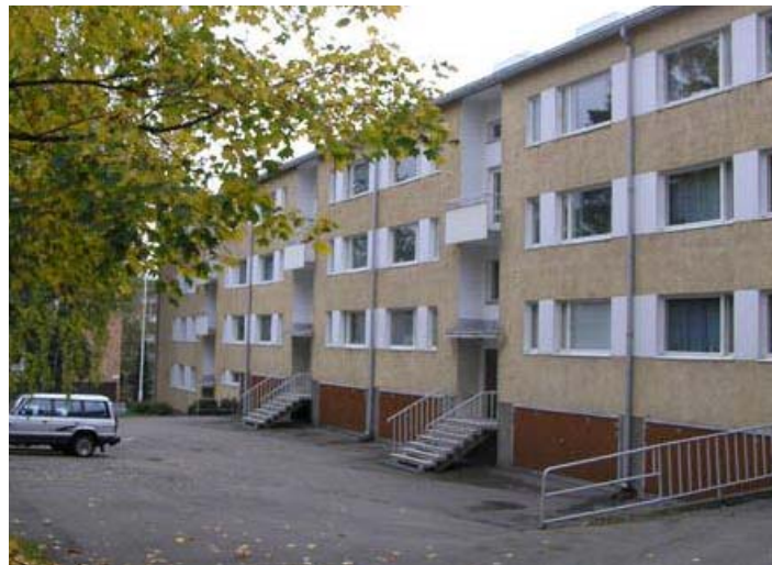
Angervotie 4:n toinen rakennus, jossa Väinö Koivula asui yli 30 vuotta.

Liitto peri Koivulalta Etelä-Haagan kaupunginosassa, osoitteessa Angervotie 4 F 59, 00320 Helsinki, sijaitsevan asunto-osakkeen. Asunto käsitti kaksi huonetta ja keittokomeron ja sen pinta-ala oli 39,5 m 2 . Asunnossa oli parvekekin. Asunnon lisäksi liitto peri HPY:n puhelinosuustodistuksen ja yli 200.000 markkaa talletuksia.