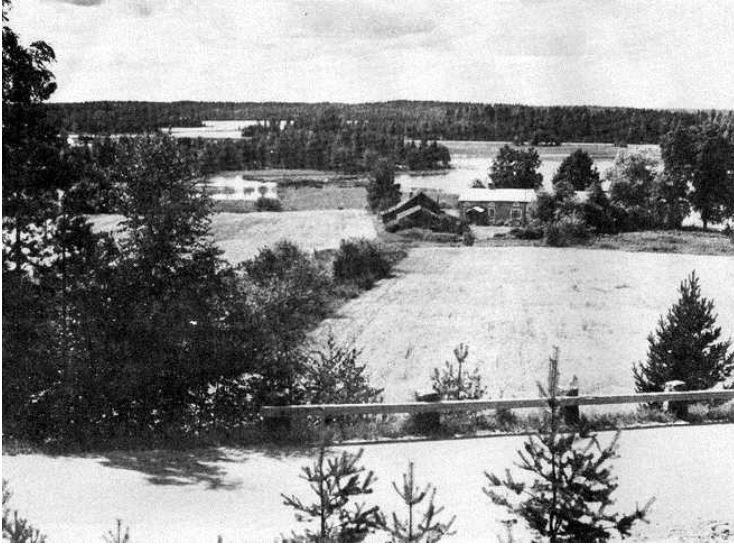
Näkymä Nikin tilalle.