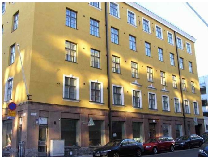
Albertinkatu 6, talo, jossa Väinö Voipio asui eläkepäivinä.

Vapaa-ajattelijain liiton kultainen ansiomerkki Voipiolle myönnettiin hänen 85-vuotispäivänään 11.12.1969 (VAJ 1969:8, 191; VAJ 1971:3, 71). Myöhemmin hänet kutsuttiin liiton kunniapuheenjohtajaksi (VAJ 1971:3, 71; VAJ 1971:5, 113).